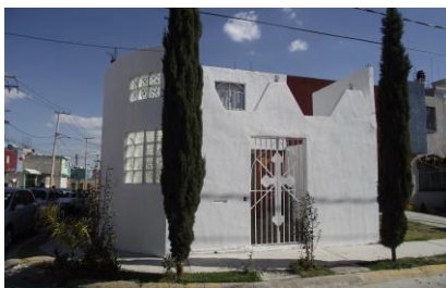
Centro Fraternidad Rosacruz de México

Asista al Centro, lo invitamos a las pláticas y los Servicios dominicales y de Curación, la Enseñanza Rosacruz toma en consideración el trabajo sobre el corazón y la mente, indicando que ambos deben ser desarrollados por igual, puesto que son esenciales para obtener Sabiduría y comprensión.