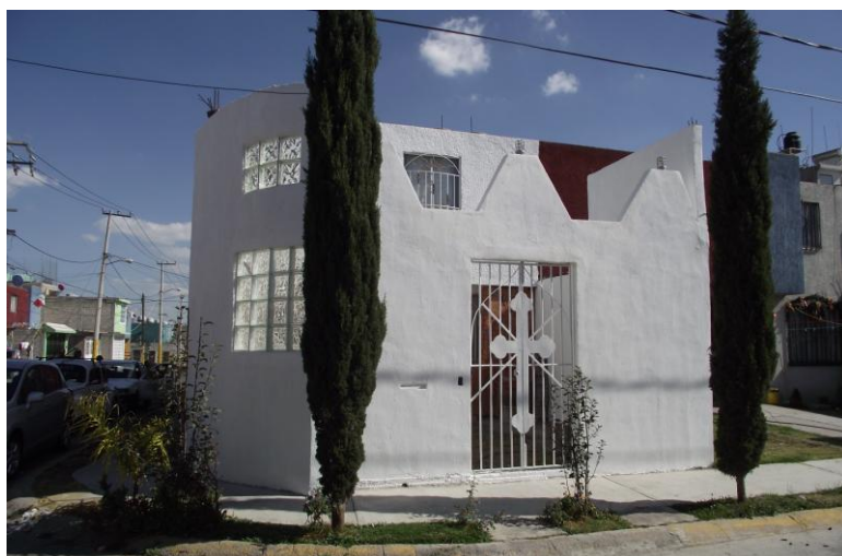
Esta es la sencilla residencia del CFRM como actualmente se aprecia.

Asista al Centro, lo invitamos a las platicas y los Servicios dominicales y de Curación, la Enseñanza Rosacruz toma en consideración el trabajo sobre el corazón y la mente, indicando que ambos deben ser desarrollados por igual, puesto que son esenciales para obtener Sabiduría y comprensión.