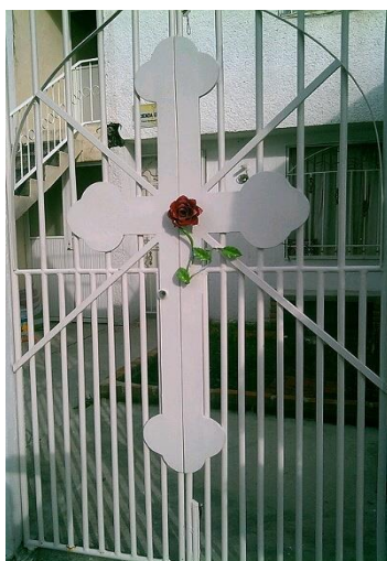
Centro Fraternidad Rosacruz de México Filial de:

Asista al Centro, lo invitamos a las pláticas y los Servicios dominicales y de Curación, la Enseñanza Rosacruz toma en consideración el trabajo sobre el corazón y la mente, indicando que ambos deben ser desarrollados por igual, puesto que son esenciales para obtener Sabiduría y comprensión.